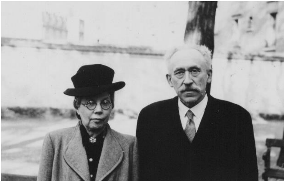
Fig. 6: El matrimonio Minkowski en 1940, en una reunión de la OSE (organización de ayuda a los niños, sobre todo judíos víctimas de traumatismos de guerra).