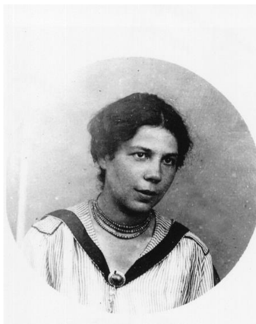
Fig. 2: F. Minkowska en su etapa estudiantil.