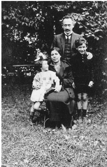
Fig. 5: