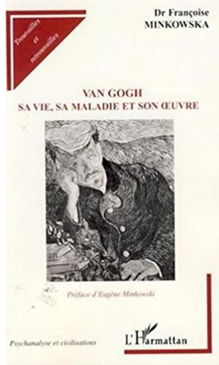
Fig. 7: Portada de su obra Van Gogh, su vida, su enfermedad y su obra . Obtenida de: https://www.amazon.co.uk/Van-Gogh-vie-maladie-oeuvre/dp/2296030939