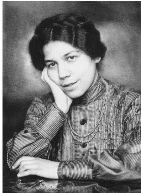
Fig. 3: F. Minkowska en su etapa estudiantil. Obtenida de: Pilliard-Minkowski J. Eugène Minkowski 1885–1972 et Françoise Minkowska 1882–1950 . Paris: L’Harmattan; 2009.105 p, [12] p. de pl.