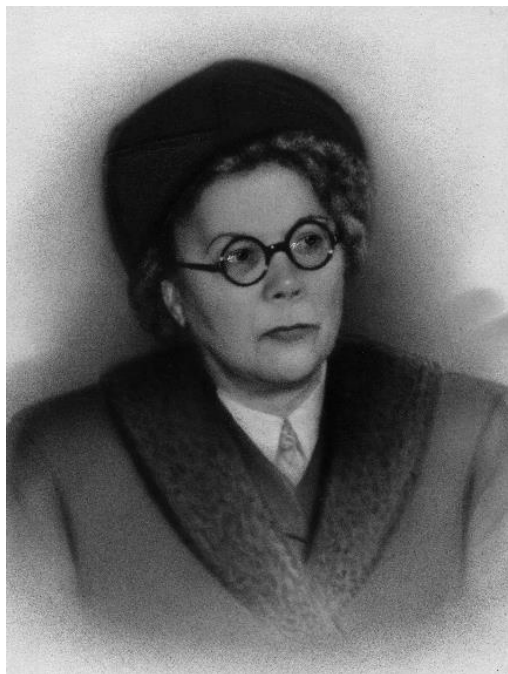
Fig. 1: F. Minkowska. Obtenida de : Pilliard-Minkowski J. Eugène Minkowski 1885–1972 et Françoise Minkowska 1882–1950 . Paris: L’Harmattan; 2009.105 p, [12] p. de pl.