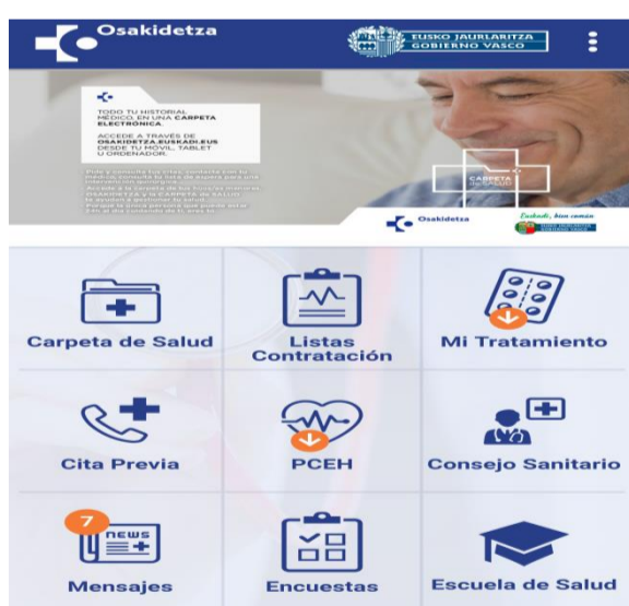
Osakidetza Portal Móvil